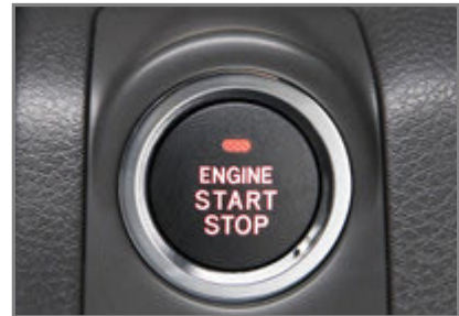
Keyless-Go ohne Zündschlüssel

Ich bin kein Freund von Automatikgetrieben. Mir fehlt die direkte Verbindung zwischen Motor und Antrieb, Bremsleistung des Motors etc. Bei dieser Automatik komme ich erstmals ins Grübeln. Soll ich mir ein Modell mit Automatikgetriebe bestellen? Diese Automatik schaltet direkt und absolut ruckfrei, egal in welcher Fahrsituation. Beim manuellen Zurückschalten (mittels Schaltwippe) gibt die Elektronik automatisch Zwischengas. Man merkt selbst davon nichts, ausser dass man nicht mehr mit dem Kopf nickt, wenn man herunter schaltet. In Verbindung mit dem Turbomotor ergibt sich eine Harmonie, die unvergleichlich ist. Wobei wir bei einem Highlight des Subaru Legacy GT angelangt wären, dem komplett überarbeiteten Turbomotor.