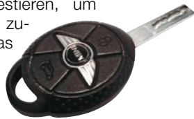
Enttäuschung: Mini erfüllt die Erwartungen der Kunden nicht

Zufriedene Kunden kosten Geld – und der Einsatz ist trotzdem jeden Cent wert. Wie viel genau, beschreibt ein Marketing-Strategie eines Fahrzeugherstellers so: »Nehmen wir mal an, wir müssten einen Euro investieren, um einen aktuellen Kunden so zufriedenzustellen, dass er das nächste Mal automatisch wieder ein Auto von uns kauft. Dann würde es mindestens zehn Euro kosten, ihn in einigen Jahren wieder zurückzugewinnen,